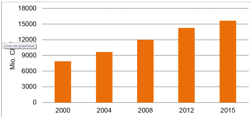
Dépenses de R-D intramuros en millions de francs; source: OFS